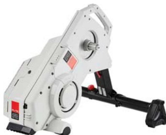
ELITE - DRIVO