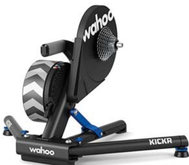
Wahoo - KICKR