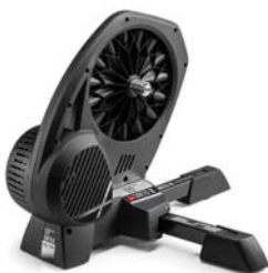
ELITE - DIRETO