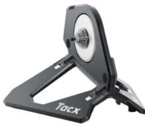
TACX - ALL NEO