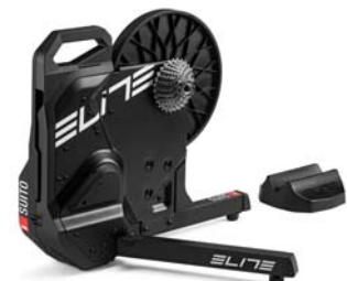
ELITE - SUITO