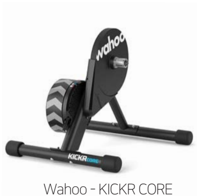
Wahoo - KICKR CORE