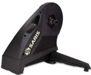
SARIS- Hammer 1, 2, 3

참고: 피팅 가이드에 나오는 모든 제품은 700c 로드 자전거로 호환성 여부를 확인하였습니다. 즉, 사용자 자전거 사이즈와 휠사이즈에 따라 측정값이 달라질 수 있습니다.