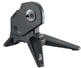
TACX - FLUX